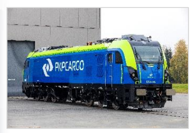
24 lokomotywy dwusystemowe Dragon 2

Nowe inwestycje w segmencie intermodalnym